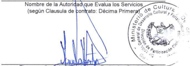
Firma y sello de la Autoridad que Evalua los Servicios (según Clausula de contrato: Décima Primera)